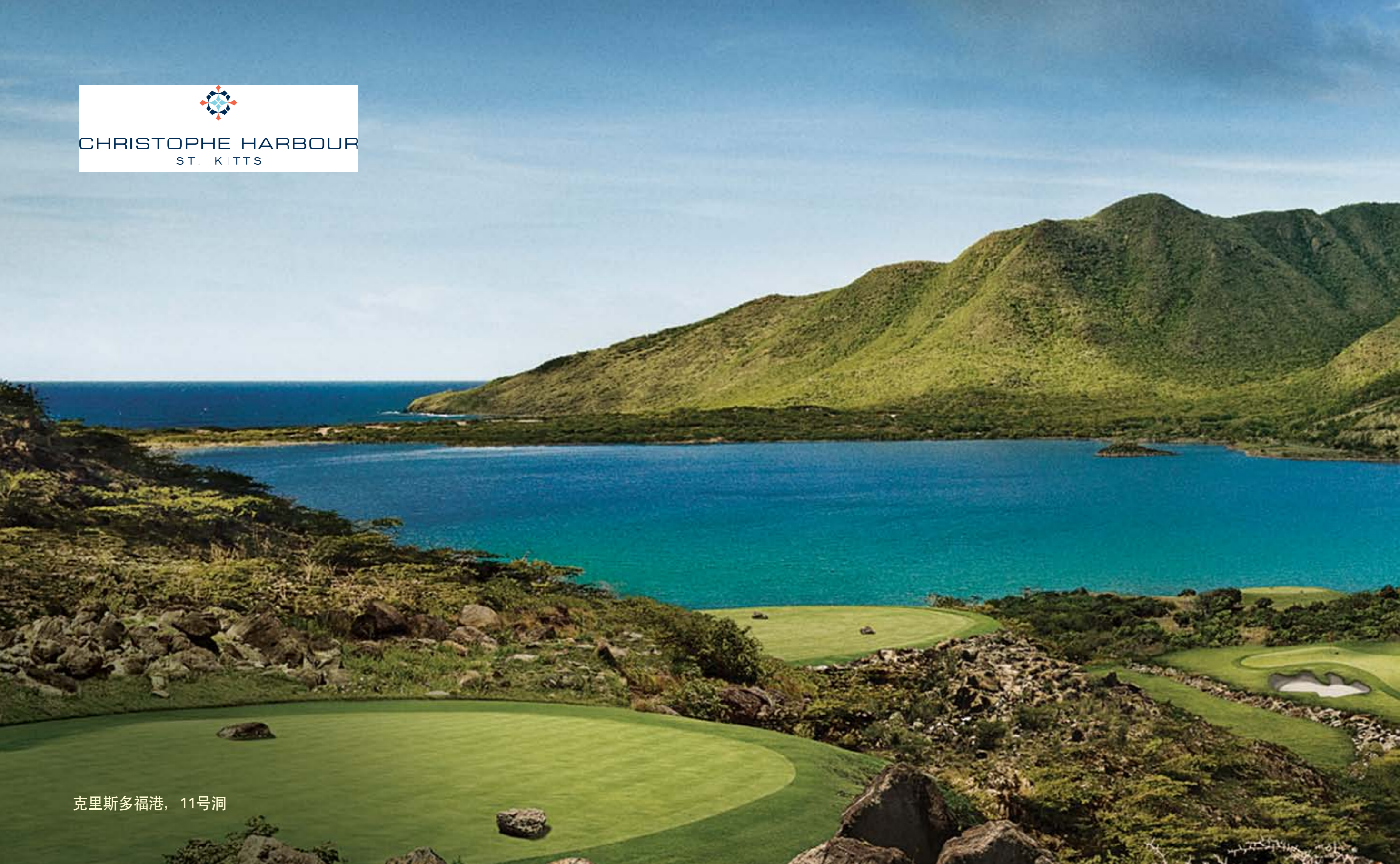
克里斯多福港, 11号洞