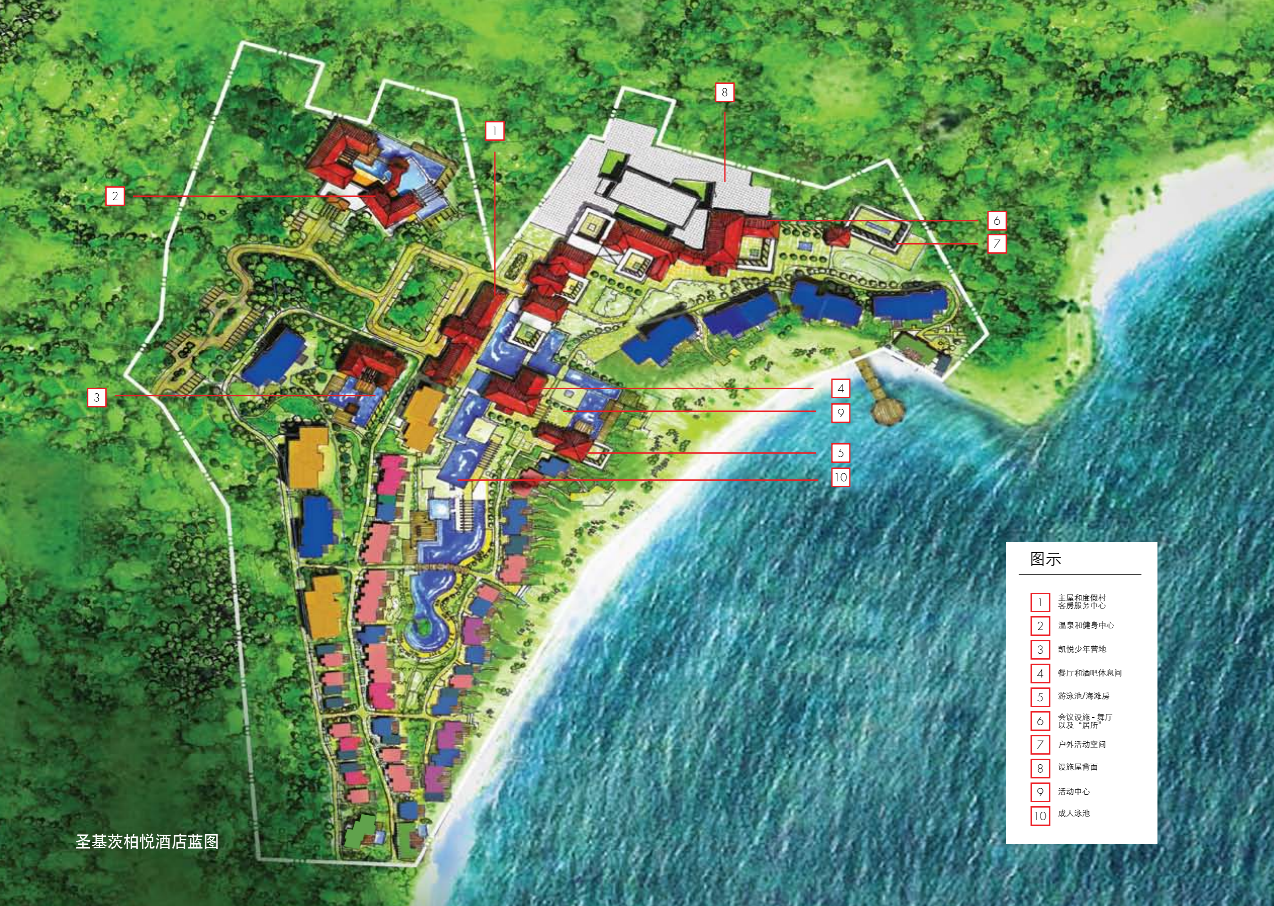
圣基茨柏悦酒店蓝图