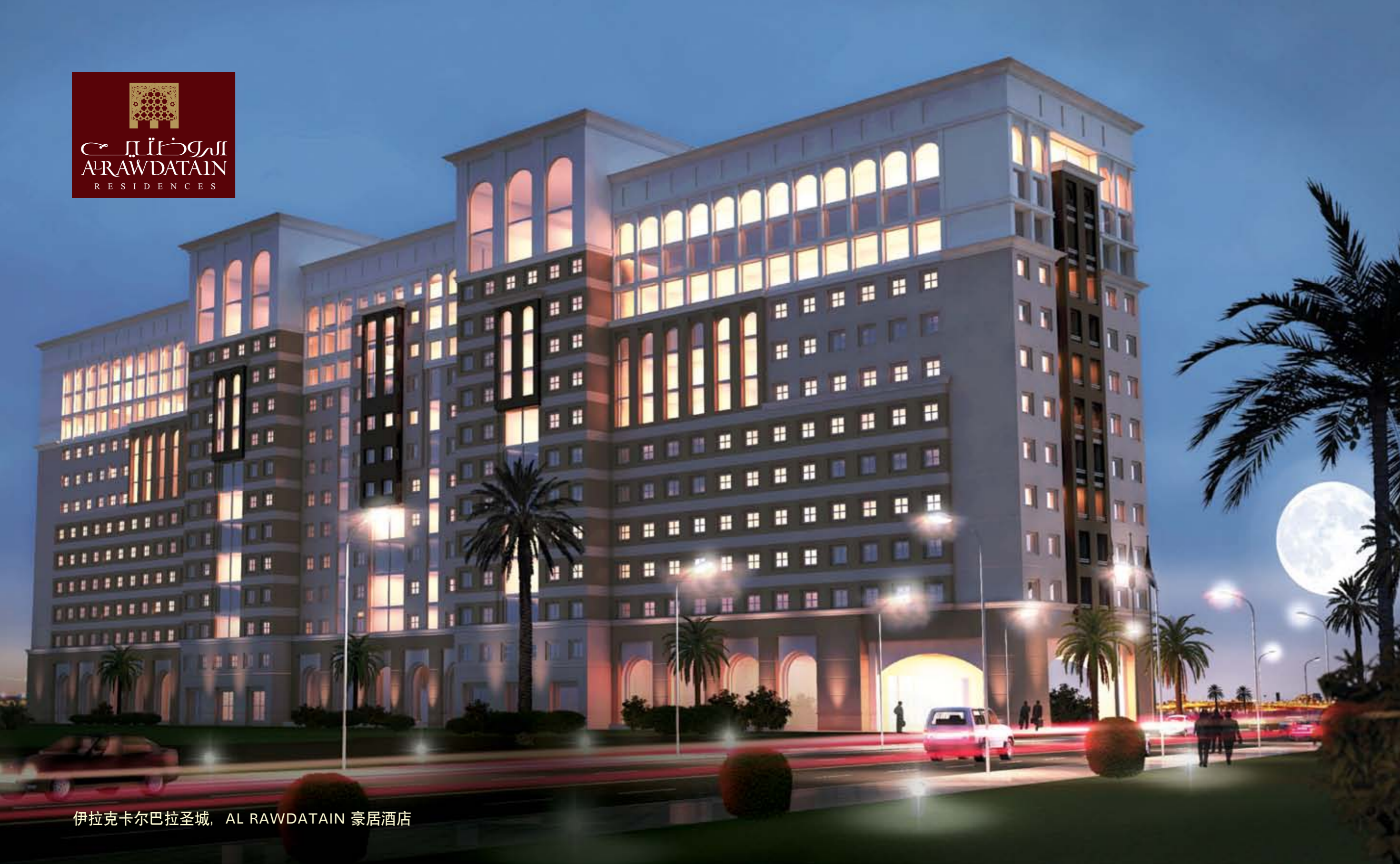
伊拉克卡尔巴拉圣城, AL RAWDATAIN 豪居酒店