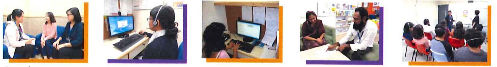
Serbisyonang (EIS) Interpretasyong On-site (Pagsama)

Harapang Serbisyonang Interpretasyon (OSIS) Whatsapp 56344587