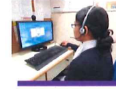
अनुवाद/ प्रूफरीडिङ सेवा (TS/PS)