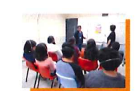
समकालिक दोभाषे सेवा(SIS)